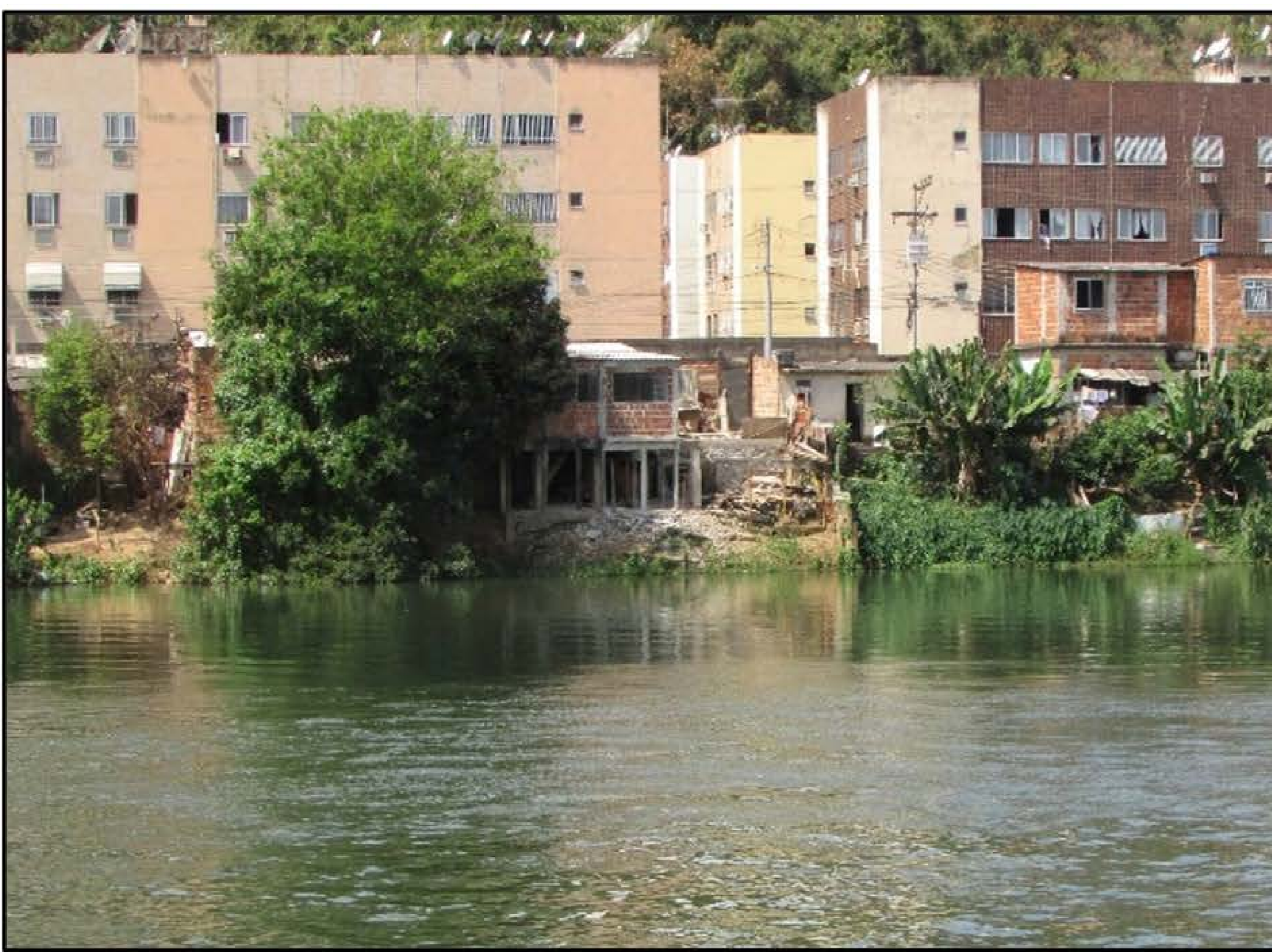
Figura 1 - Ocupações irregulares ao longo do Rio Paraíba do Sul nos municípios de (a) Volta Redonda (2017) e (b) Barra Mansa (2020)

O crescimento das cidades atrelado a ausência ou o planejamento urbano inadequado do território, a falta de disponibilidade de terras junto aos centros urbanos, a inexistência da provisão de moradia para a população de baixa renda, entre outros, são algumas das circunstâncias que fazem com que as APPs sejam antropizadas. Constroem-se edificações comerciais, industriais, equipamentos urbanos, vias públicas, e majoritariamente habitações, consolidando-se nas cidades, por vezes, de forma irreversível (MINISTÉRIO PÚBLICO FEDERAL, 2017). A Figura 1 ilustra ocupações irregulares ao longo do rio Paraíba do Sul.